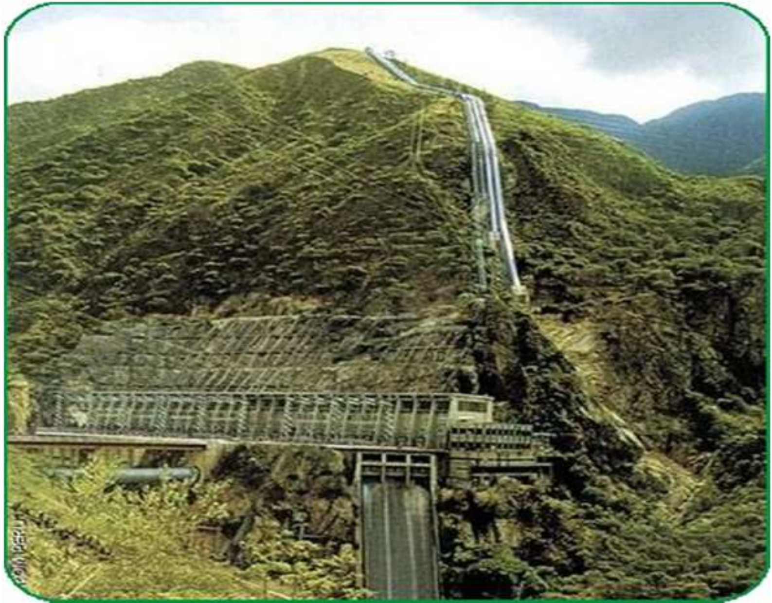
VISTA: Central Hidroeléctrica Santiago Antúnez de Mayolo - Colcabamba